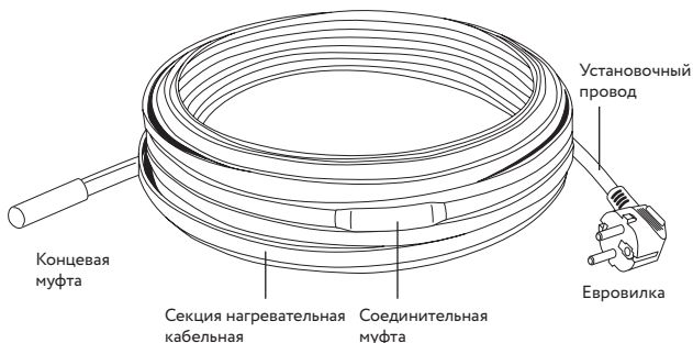
Рис. 1. Конструкция секции нагревательной кабельной PipeMate

Нагревательная секция состоит из саморегулирующегося нагревательного кабеля, оснащенного с одной стороны соединительной муфтой и установочным проводом с евровилкой на конце, а с другой стороны – концевой муфтой (см. рис. 1).